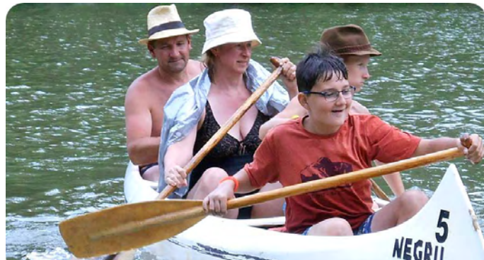
„Egy csónakban evezünk” (2018)

mutatja, s homokos „padmajok” várják a hűsölni vágyókat. Esténként a gát oldalára feküdvé eget kémleltünk, mert olyan csillagos eget máshol nem látni, mint a körösszakáli gát oldalában. Számtalan hűtőtáskával felszerelve, a jégakkukat a falu kocsmáiba behordva, utánfutóra hegesztett kenuszállítóval biztosítottuk a logisztikát.