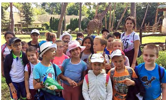
Erzsébet táborosok a Debreceni Állatkertben

Három turnusban 5-5 napos programban vet t részt 140, 48 és 26 összesen 214 diákunk.