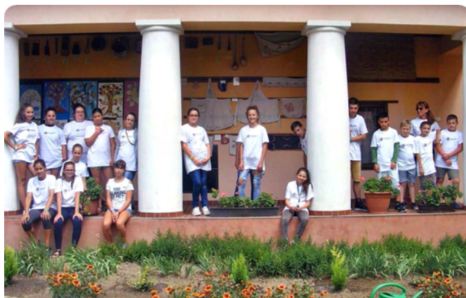
Kertészkedés az Erzsébet táborban

Az EFOP-os pályázatunknak köszönhetően a legjobban teljesítő diákjaink egy része szintén napközis, mások Budapest-Dunakanyarba szervezett ottalvós táborban vettek részt. Az 5 illetve 6 napos program ebben az esetben is tartalmasra sikeredett, 80 és 50 diák élvezhette. A tematikus programokat pedagógusaink állították össze, a pályázati kiírásnak megfelelően.