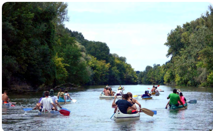
Csónakokban a csapat (2018)