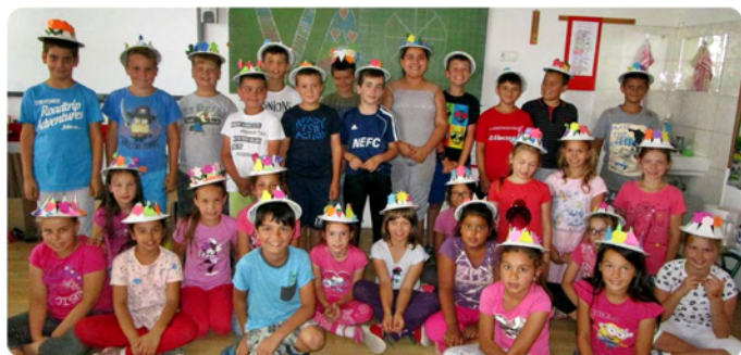
Erzsébet táborosok – alkotás után

Először a nyári Erzsébet-napközis táborról szeretnék beszámolni, amely sok diáknak szerzett örökre szóló élményt, tapasztalatot, örömet.