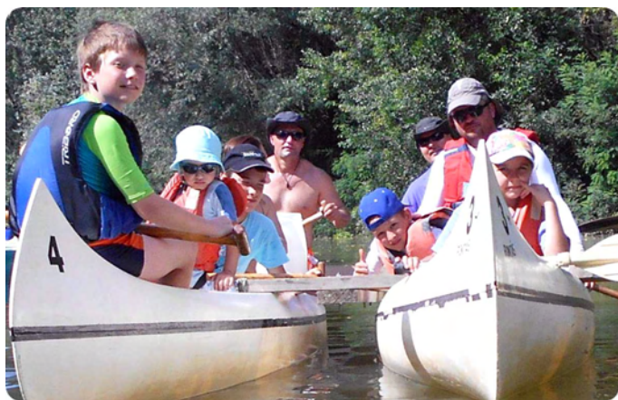
Itt már senki sem kezdő! (2018.)

Ezek azok a pillanatok, amelyek tovább lendítik a nehézségeken a Kaptányt, amikor a jószándék és bizalom elveszni látszik (s rá kell döbbsennie, hogy a jutalom nem mindig érték).